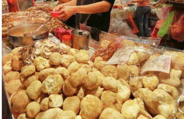
衛生局提醒選購年貨要特別留意。(示意圖)