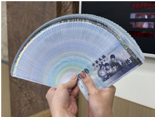
陳姓女子誤信愛情詐騙損失1百多萬後，又被無良代辦業者騙走500多萬。示意圖（資料照）