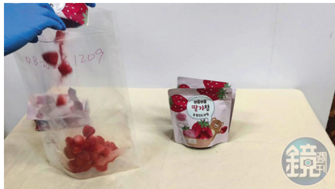
韓國「BEBE貝兒冷凍乾燥水果（草莓）」，驗出2種農藥，殘留量都為0.06ppm。