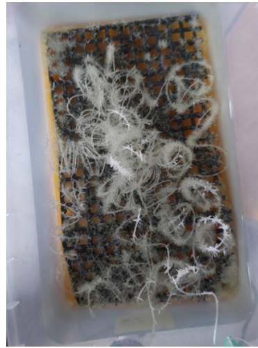
毒梟躲廢棄工廠煉毒，市值破億，桃檢起訴2人分求15、12年重刑。