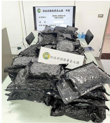
行李塞滿61公斤乾燥大麻「市價破億」 畫面曝 2外國男下場曝