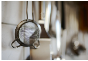
不鏽鋼廚具、餐具等經常接觸食品的工具應定期更換。示意圖／取自免費圖庫 PIXABAY