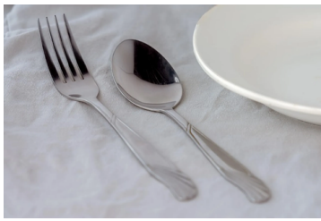
不鏽鋼餐具。示意圖