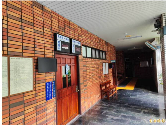
高市李姓模範警察替詐團首腦查個資，被高雄高分院從輕改判。