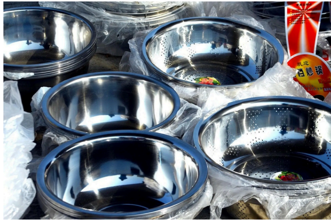
選購不鏽鋼餐具時應避免購買來路不明產品。示意圖