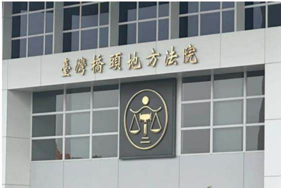
橋頭地方法院。