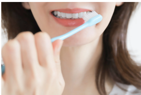
日本牙醫建議刷完牙，牙刷不要直立放，避免潮濕導致細菌孳生。(示意圖)