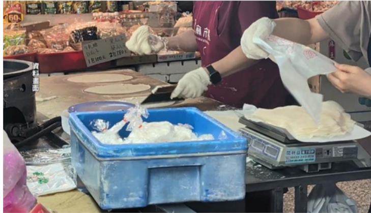
高雄春捲店173人食物中毒 老闆娘展現誠意協調賠償