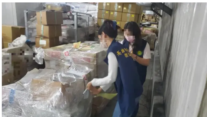
▲食藥署公布，高雄市的「東侯實業股份有限公司」遭查獲在倉庫貯存逾期食品。