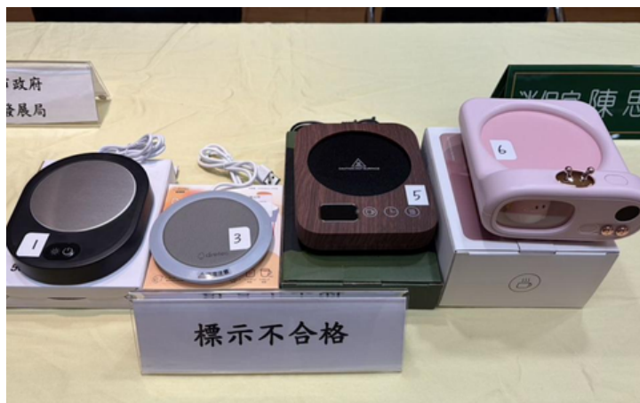
圖／新北市政府消費者保護官隨機購買7件的'保溫杯墊'商品，僅1件完全合格。 (新北市政府消費者保護官提供)