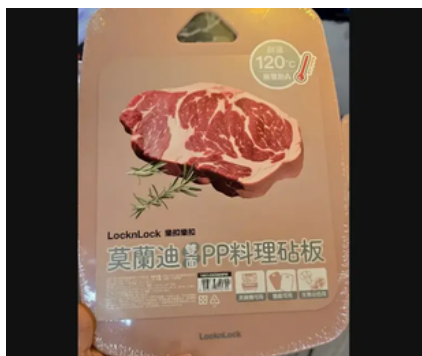
▲樂扣樂扣莫蘭迪雙面PP料理砧板因標示不合格，遭衛生局裁罰。(圖／食藥署提供)