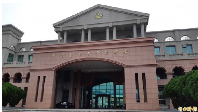
台東地檢署。(資料照)