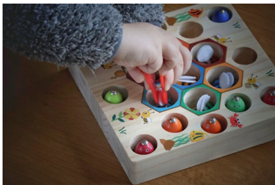
就連玩具也暗藏危機！幼兒體內竟驗出96種「有毒化學物質」。示意圖／Pixabay