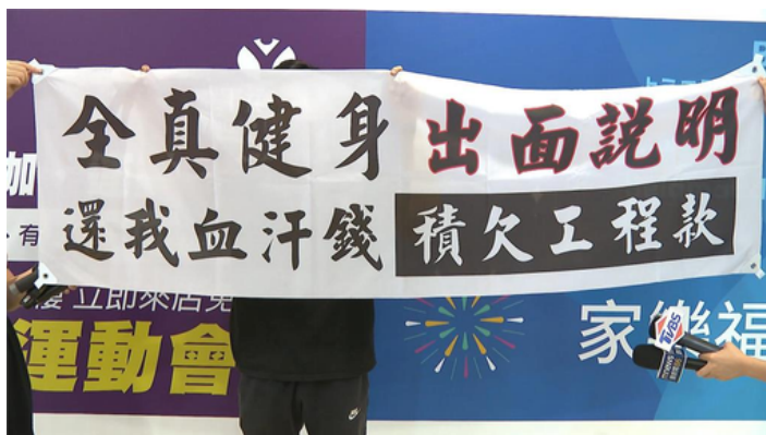
有廠商指控全真積欠工程款。