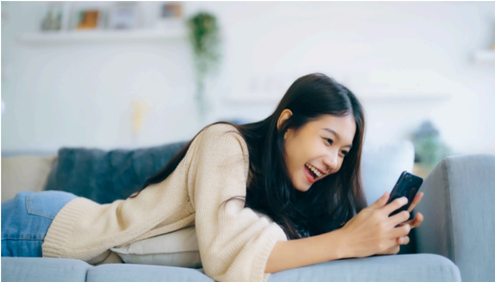
專家警告，網購時在網站上儲存信用卡資料，很容易被盜用。

網購方便，讓許多人懶得出門購物、愛叫外送，但資安危機也跟著增加，網路安全服務公司「Fortalice Solutions」戰略長歐蕾莉近日警告，網購時儲存信用卡資料的習慣，很容易成為網路犯罪下手的目標，並教6招反制，包括停止儲存信用卡資料、用加密工具儲存密碼、啟動雙重驗證等。