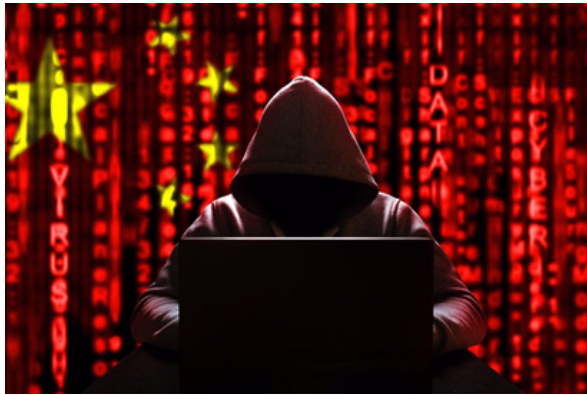
國安局揭大陸網駭政府與企業最新手法。