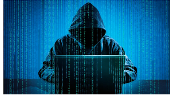
駭客示意圖。