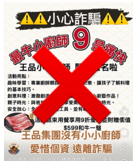
王品遭不肖人士陷害，詐騙集團誤導民眾回應個資。