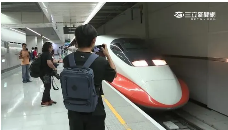
▲根據台灣高鐵官網，旅客運送契約第26條規定，旅客持車票自旅行開始至完成時間不得超過3.5小時，列車遲延或運行中斷除外。

事實上，根據台灣高鐵官網，旅客運送契約第26條規定，旅客持車票自旅行開始至完成時間不得超過3.5小時，列車遲延或運行中斷除外。如果旅客在到站後辦理補票，需在補票後1小時內離開付費區，若沒有正當理由，超過上述時間者，高鐵公司有權加收一張全區間商務車廂全額票價，即2500元違約金。民眾年假返鄉、旅遊期間，可要注意，以免遭罰款。