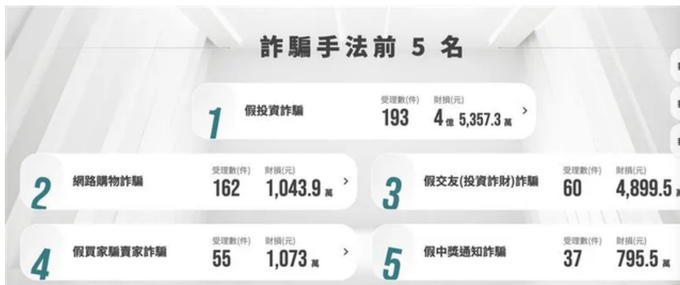
台灣人遭詐騙類型以「假投資詐騙」最多，每日造成破億財損。

內政部警政署統計，詐騙手法以「假投資」最多，每日最少造成上億元財損，光4日單日就收到193件造成4.5億財損；其次是「網路購物詐騙」、「假交友（投資詐財）詐騙」、「假買家騙賣家詐騙」、「假中獎通知詐騙」。而在網購最火熱的雙12購物節前的週末，「網路購物」被受理的詐騙案最多，每日都超過百件，但被詐騙金額仍是以假投資詐騙最多，動輒上億。