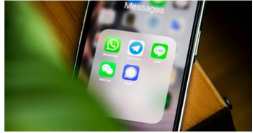
歹徒假冒金融機構，透過張貼借貸廣告吸引民眾以LINE聯繫。