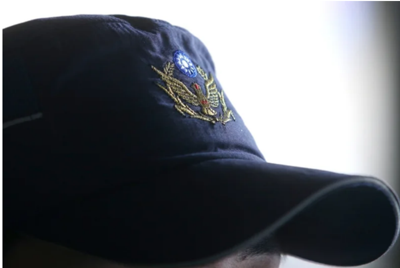
警察示意圖。