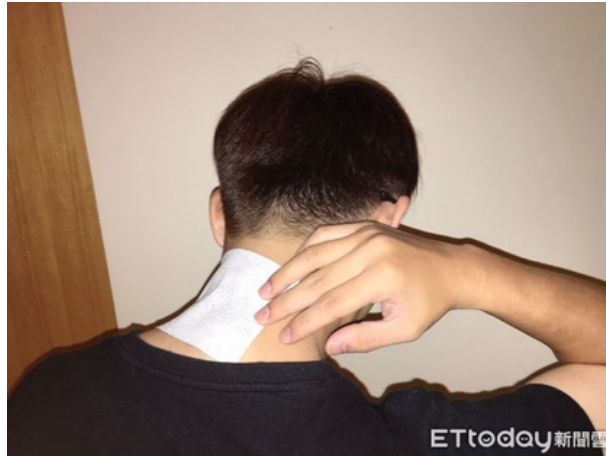
▲許多人覺得腰痠背痛時，第一個想到的就是貼酸痛藥布。