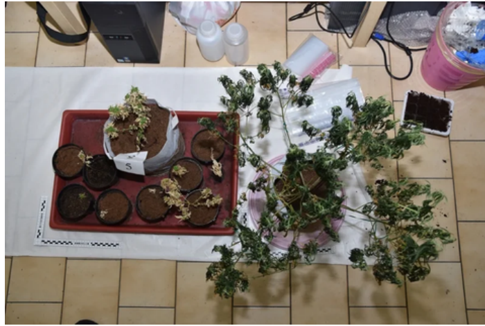
警方查獲顏男、張男在北區民宅種大麻。