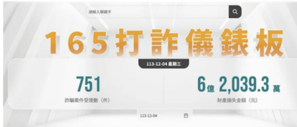
內政部警政署設立「打詐儀錶板」網站，本月4日當日受理751件遭詐6.2億。