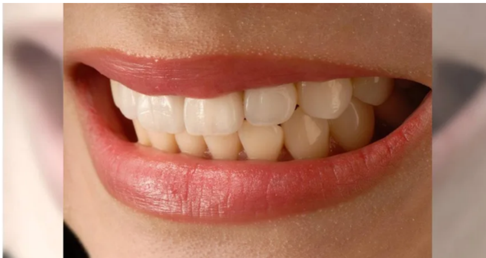
腎臟科醫師洪永祥遇過一名糖尿病病患，使用「訂書針剔牙」導致意外感染，半年後就因為腎衰竭，需要面臨終身洗腎。(示意圖/Pixabay)

對此，洪永祥也提醒，千萬不要小看剔牙的動作，剔牙還是要使用合格的牙線，口腔黏膜相當脆弱，不要亂使用尖銳的東西戳牙齦。