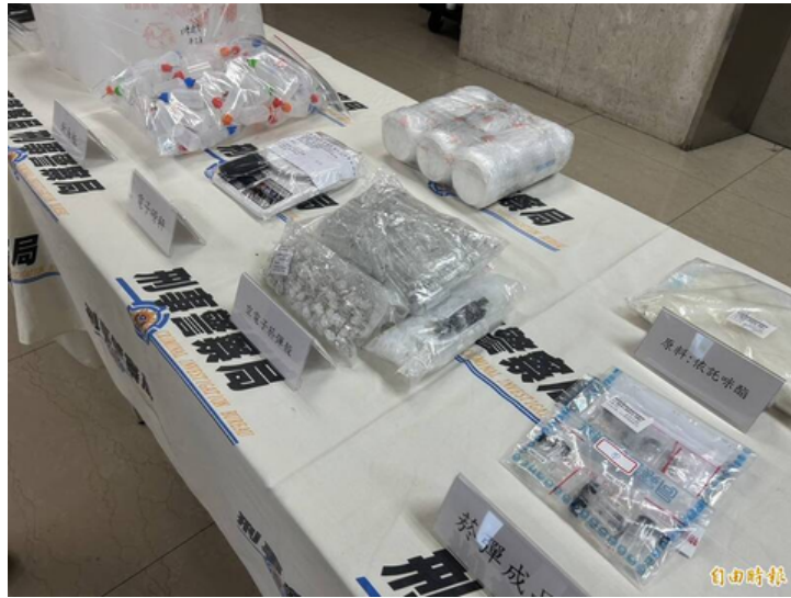
警方首破「喪屍毒品」依托咪酯電子菸分裝場，查獲原料、電子菸油彈頭、加熱儀器、磅秤等大批工具。