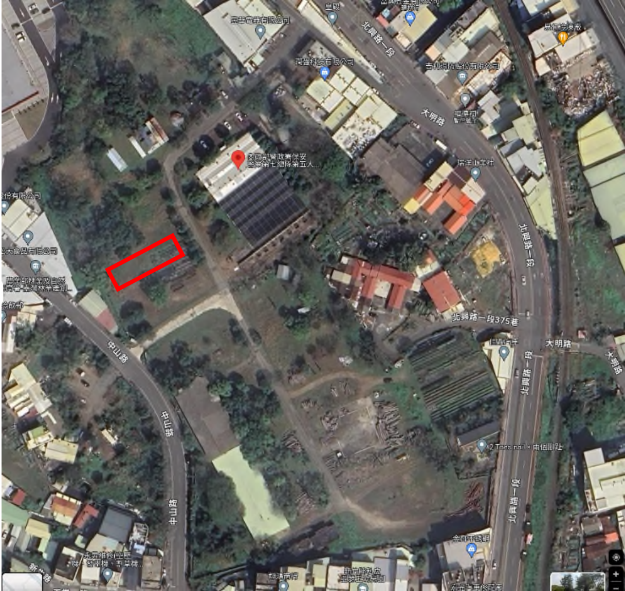
地點：新竹分署竹東貯木場