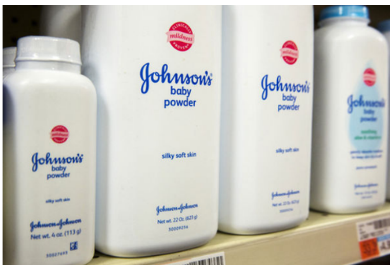
▲ 嬌生嬰兒爽身粉面臨致癌訴訟。