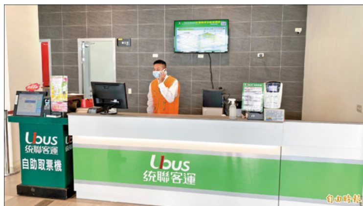
統聯客運5月間網站遭駭客攻擊，3個月內有四萬多筆個資遭竊取。

他補充，統聯客運防火牆都已更新，也強化資安防護，訂票改採無個資方式處理，由民眾設定一次性的取票號碼與密碼，不再需要留下姓名、身分證字號、電話等個資，即便再遭駭客攻擊，也沒有個資會外流。