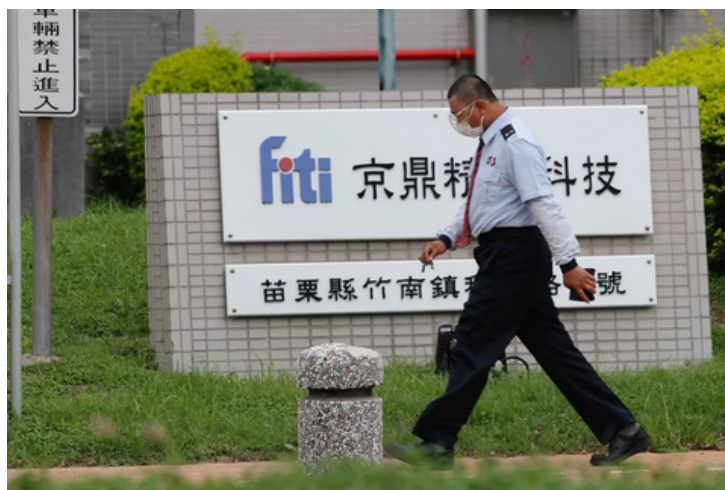
鴻海集團子公司京鼎傳出遭駭客入侵。

據美國網路安全暨基礎設施安全局（CISA）報告指出，LockBit是二〇二二與二〇二三年最活躍的勒索軟體，光針對美國企業發動的各種勒索即服務攻擊，駭客集團不法所得便超過九一〇〇萬美金。