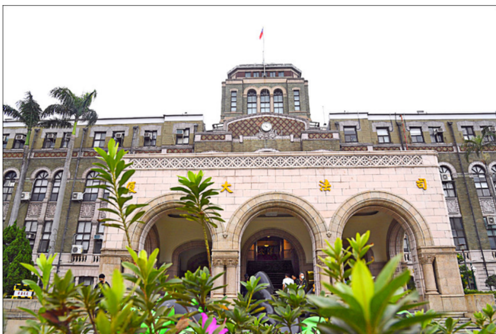
司法院所屬各法院在民眾洽公區域配置「民眾查詢機」，主機4月間遭駭客入侵，經清查共923起個資外洩。

此外，去年十一月底遭駭客入侵的雄獅旅遊，相隔一年，今年十一月廿日再成攻擊對象。雄獅旅遊表示，當天凌晨經系統主動偵知，遭不明人士惡意透過網路攻擊公司作業系統，已通報主管機關、檢調單位。強調遭駭客攻擊受損範圍包含顧客姓名、聯絡方式、商品內容，但不包括消費者信用卡資料，目前公司營運及出團狀況均正常。