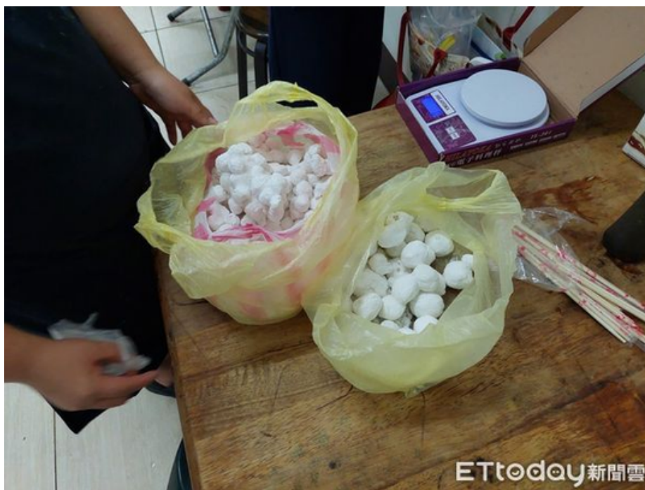
▲衛生局冬至食品抽驗28件，結果皆合格。

此外，因湯圓外皮多以糯米為主黏性高，對於咀嚼不全之民眾，例如老人或小孩應小塊慢慢進食，以免造成消化不良或食道阻塞的危險。