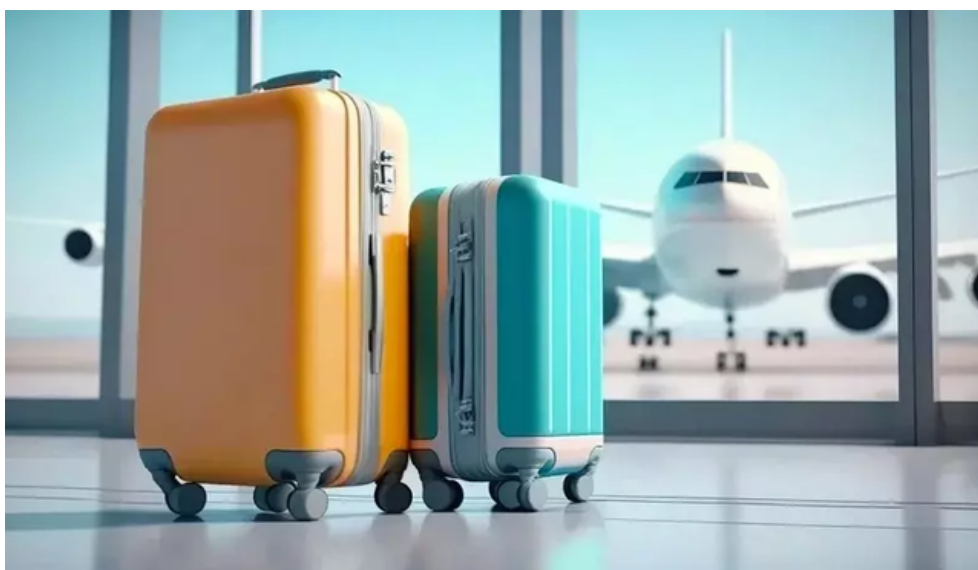
行李箱久未使用，輪子恐存在破裂風險。示意圖。

也有許多人分享自己的獨門妙計，「如果一直都沒有使用，幾個月要拿出來推一推，擠壓出PU裡的空氣，輪子壽命會更長一點，一直放著不用氧化速度會比較快，如果發現輪子有點反白就是快壞了，建議換掉再出門」、「輪子不用換了，拿來收納棉被衣服等等，直接買新的」、「我是貼電工膠布也很好用，寬度跟輪子差不多，黏性也很強，不會影響輪子滾動」。