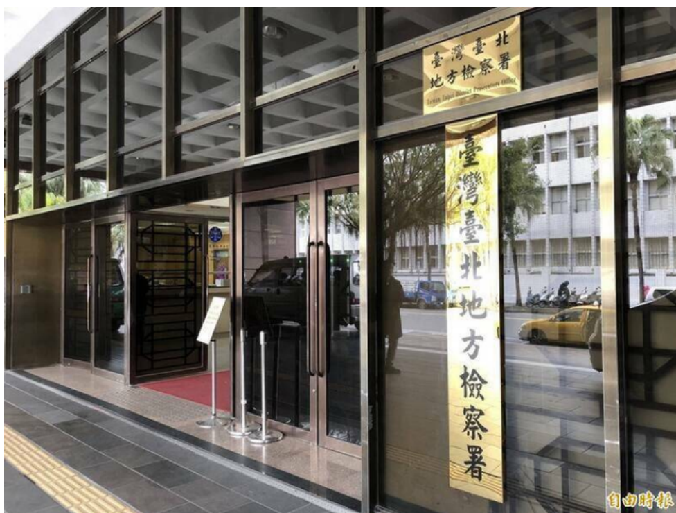
圖為台北地檢署。（資料照）

據了解，黎男庭訊時承認向謝男索討2萬7000元，但否認涉及貪污。謝男則證稱黎男確實有開口向他要錢，討價還價之後才降為2萬2000元。