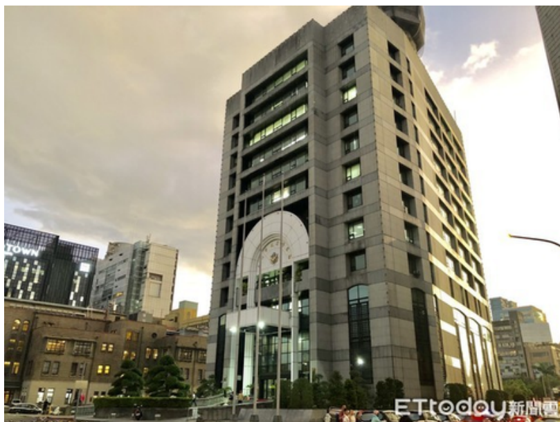
▲台北市警察局遭指採購警員密錄器有資安外洩疑慮。

北市警局強調，台北市警方向來重視警用資訊安全問題，為避免類似疑義，爾後辦理採購時，將綜合市場產品狀態，審慎評估是否限制相關中國大陸零組件，堅守採購品質並確保資通安全不受威脅。