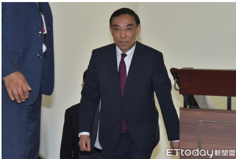
▲法務部長蔡清祥。

而陳建仁26日在立院接受國民黨立委曾銘宗質詢時，承諾3個月會破案，蔡清祥強調，法務部會全力偵辦所有涉及犯罪違法的事情，不一定會有期限，但一定全力偵辦。