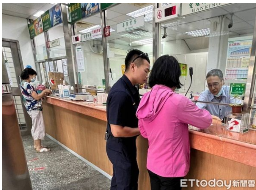
▲不少民眾遭詐騙前往郵局匯款，所幸郵局員工識破攜手警方攔阻。

中華郵政強調，目前正規劃於中華郵政全球資訊網建置防詐專區，張貼防詐宣導圖文及影片，民眾可至網頁查詢各式詐騙態樣；亦配合金管會規劃之「金融機構全國368鄉鎮走透透反詐宣導」活動，前進29個偏鄉(如新竹尖石鄉、南投仁愛鄉等)，會同當地警察機關辦理反詐宣導，提升民眾防詐意識。