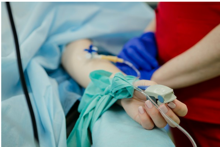
應徵諮詢師被說服抽脂豐胸「當診所招牌」，女子卻因麻醉過量慘死，4名醫師遭判刑求償。(示意圖／取自免費圖庫Unsplash)

而檢方為女子母親申請犯罪被害人補償金，獲賠77萬8175元後，也提民事求償向池、林等共在場4人求償，而法院扣除他案已賠償的金額後，判4人須再賠59萬2673元給地檢署，全案仍可上訴。