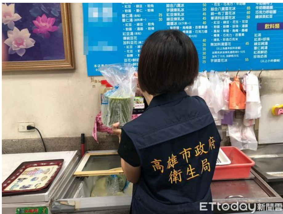
▲衛生局14日前往冰店稽查。

根據衛生局統計，此案共計有44人因症就醫，經交叉比對就醫病患的攝食食物，及現場稽查查獲多項缺失以及衛生局抽驗食品、環境、人體檢體檢驗結果綜合研判，冰店提供的自製豆類及相關配料可能為環境的污染致病源。