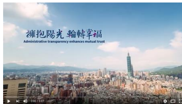
擁抱陽光 輪轉幸福