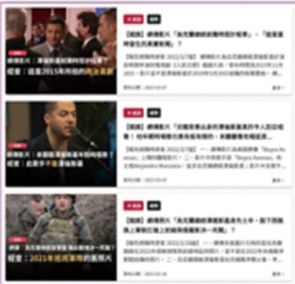
各種與烏克蘭總統澤倫斯基本人有關的資訊，雖已被證實是假訊息，但也已成功塑造其親民形象。（資料來源：台灣事實查核中心， https://tfo-taiwan.org.tw/ ）

有捐款，但並非捐給烏克蘭政府，而是捐給國際關懷協會、國際難民組織、救助兒童會，以及聯合國難民署等國際人道組織。他的捐款金額不是1千萬美元，而且他也不具烏克蘭血統，因為他的外婆並非假訊息所宣稱的是烏克蘭奧德薩人。