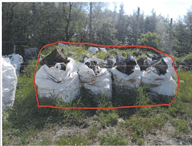
參考照片(同一批不同角度)