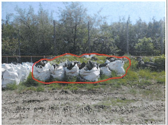
參考照片(同一批不同角度)