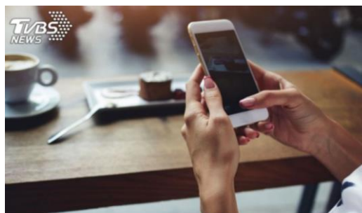
最新研究指出，冠狀病毒在手機螢幕等材質殘留時間增長。（示意圖/shutterstock 傑志影攝）

根據英國廣播公司《BBC》報導，澳洲國家科學研究機構的結果指出，現今新冠病毒主要傳播途徑，還是以咳嗽、打噴嚏和講話為主。而先前相關研究顯示，冠狀病毒可以在紙幣、玻璃上殘留約2至3天，塑膠和不銹鋼表面的殘留能力則可到6天。